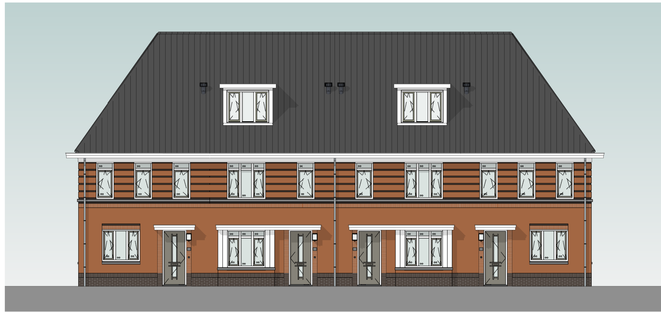
bouwnummer 139 bouwnummer 138 bouwnummer 137 bouwnummer 136