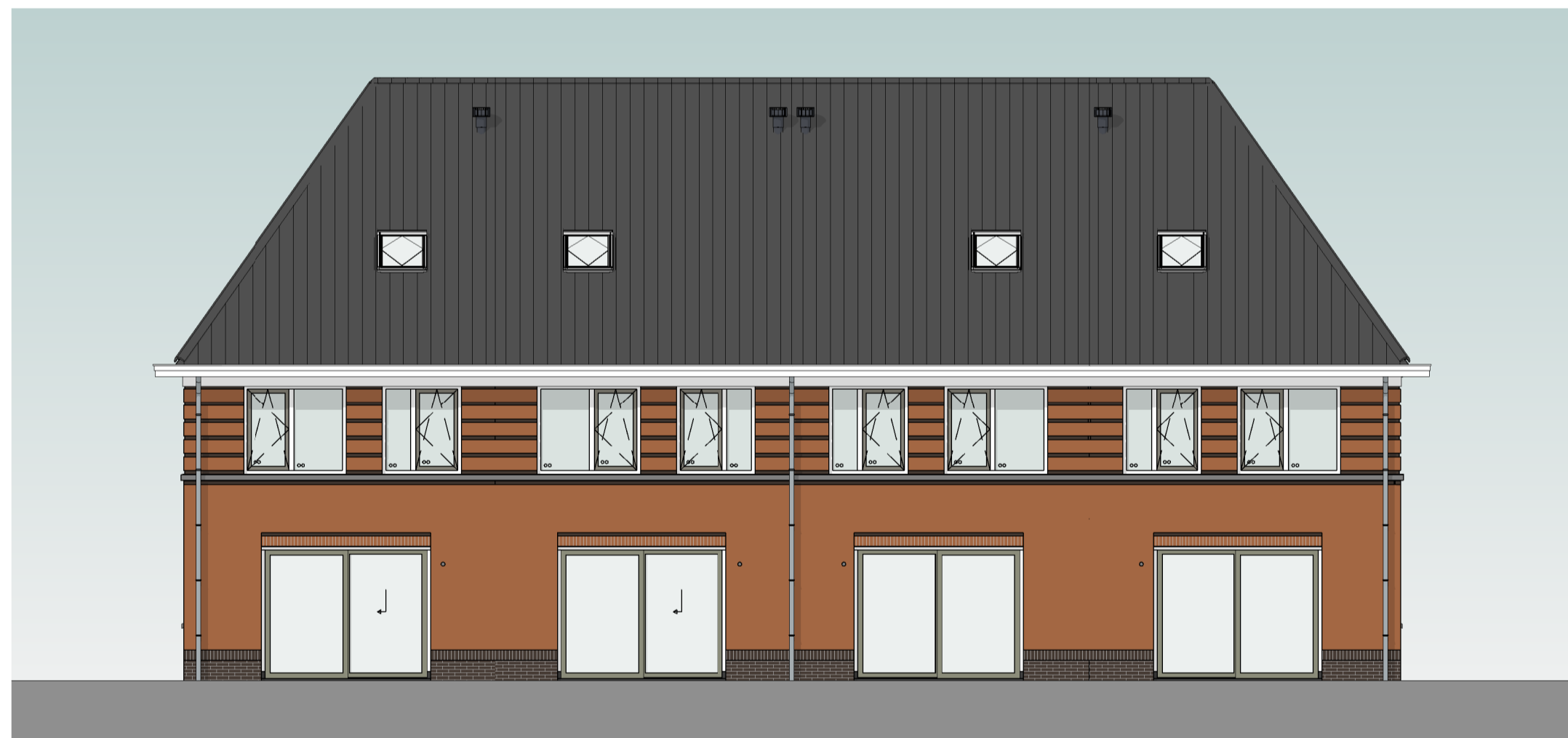
bouwnummer 136 bouwnummer 137 bouwnummer 138 bouwnummer 139